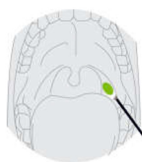
Campione di tampone orofaringeo

Inserire un minitampone con un'asta flessibile (filo o plastica) attraverso la narice parallela al palato (non verso l'alto) fino a quando si incontra resistenza o la distanza è equivalente a quella dall'orecchio alla narice del paziente, indicando il contatto con il rinofaringe. Il tampone deve raggiungere una profondità pari alla distanza dalle narici all'apertura esterna dell'orecchio. Strofinare delicatamente e ruotare il tampone. Lasciare il tampone in posizione per diversi secondi per assorbire le secrezioni. Rimuovere lentamente il tampone ruotandolo. I campioni possono essere raccolti da entrambi i lati utilizzando lo stesso tampone, ma non è necessario laddove la punta è satura di fluido dopo la prima raccolta. Se un setto deviato o un'ostruzione crea difficoltà nell'ottenere il campione da una narice, utilizzare lo stesso tampone per ottenere il campione dall'altra narice.